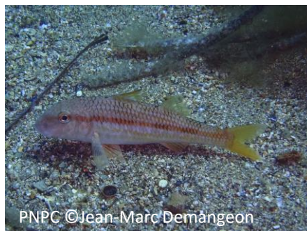
Rouget barbet Mullus surmuletus