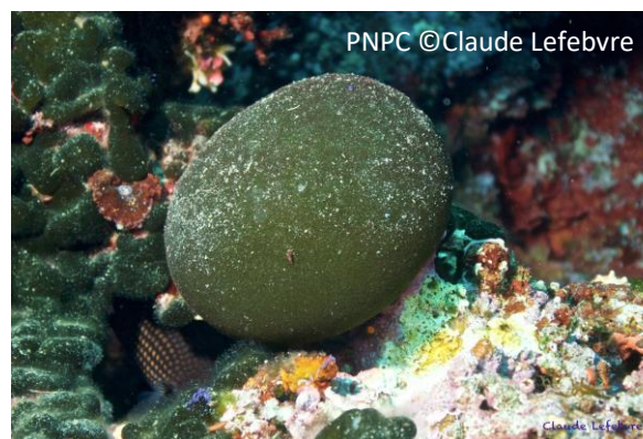
Codium en boule Codium bursa