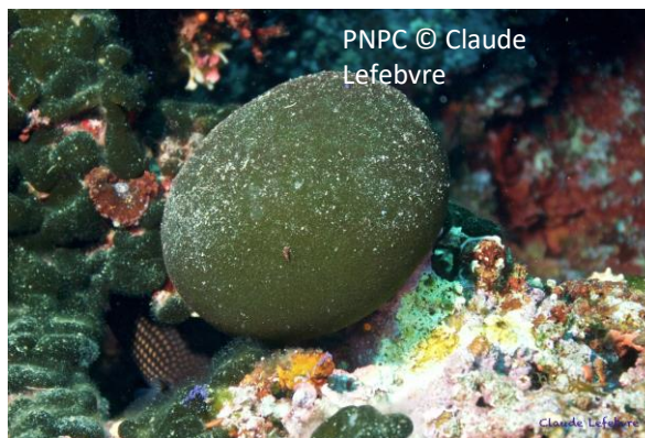
Palla verde Codium bursa