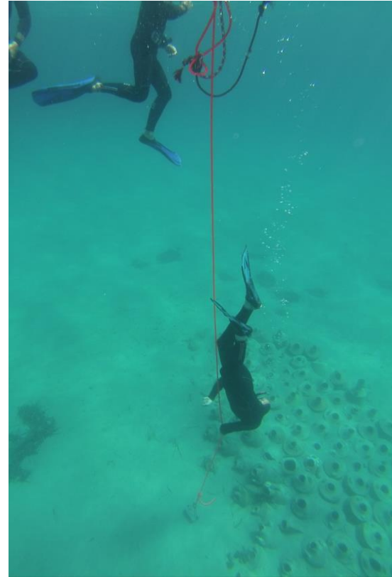
Sentier sous-marin de la pointe du Bouvet Epave romaine reconstitué