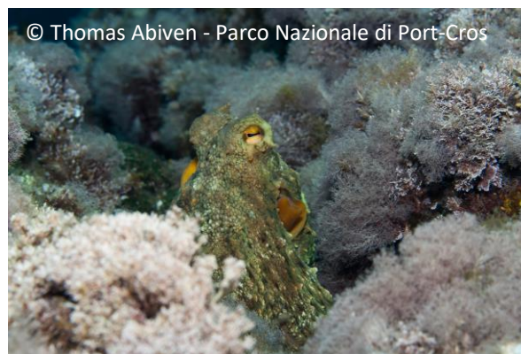
Polpo comune Octopus vulgaris