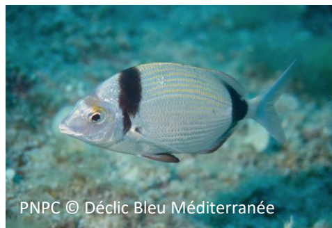
Sar à tête noire Diplodus vulgaris