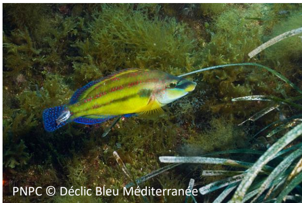
Crénilabre paon Symphodus tinca