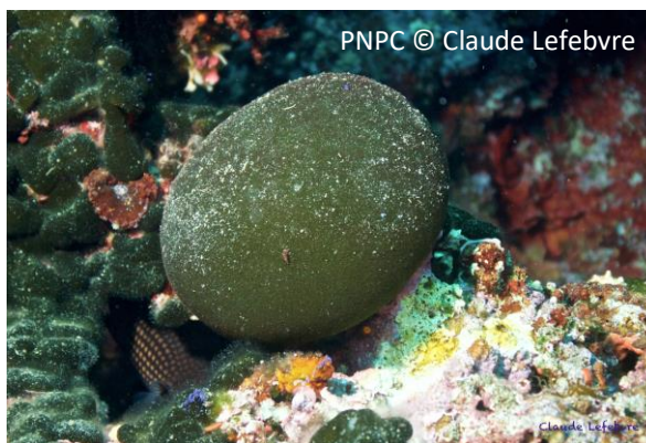
Palla verde Codium bursa