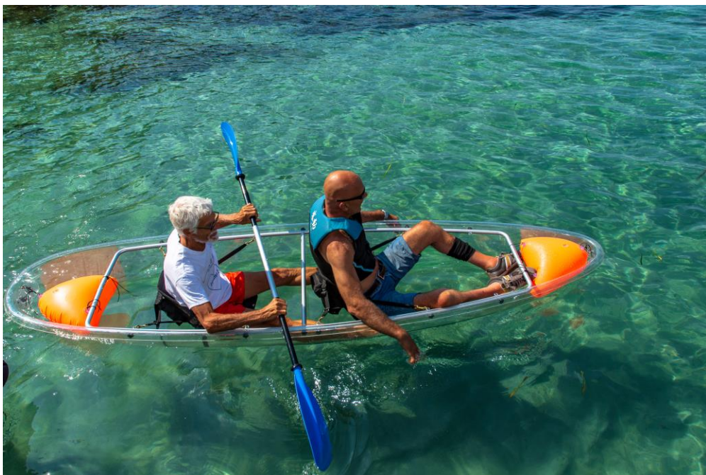
Kayak a fondo trasparente