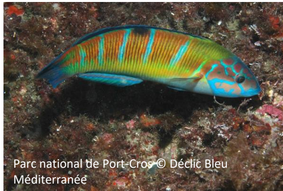
Girelle Paon Octopus vulgaris

Le sentier sous-marin de la Garonne regroupe plusieurs types de milieu (roches, herbiers, pleine eau) qui permettent l'observation d'une grande diversité d'espèces. A chaque milieu, sa bouée pédagogique.