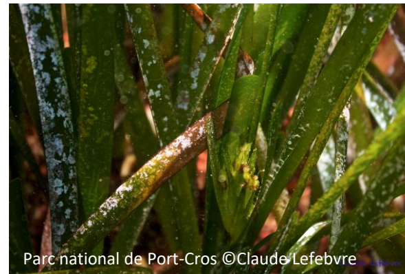
Posidonie Posidonia oceanica

Parc national de Port-Cros