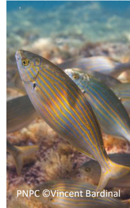
Saupe Sarpa salpa

Parc national de Port-Cros