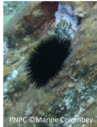
Oursin noir Arbacia lixula