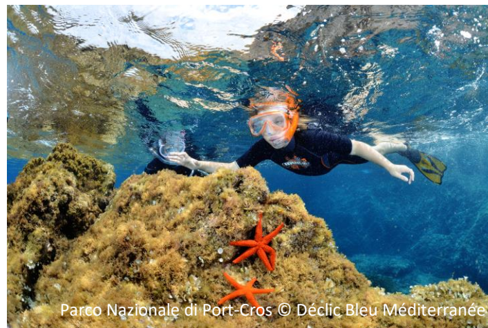
Parco Nazionale di Port-Cros

Percorso sottomarino della Plage de la Palud Stella marina rossa Echinaster sepositus