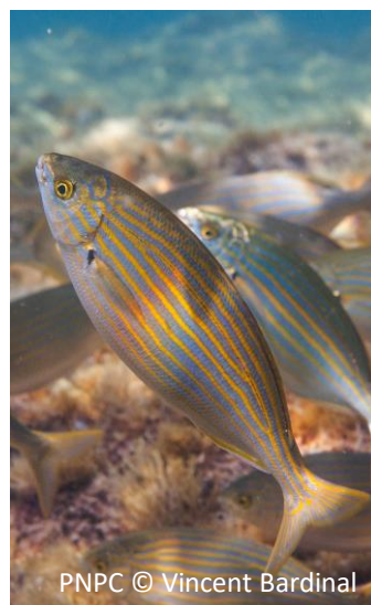
Salpa Sarpa salpa