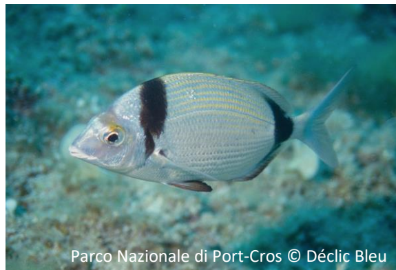
Sarago fasciato Diplodus vulgaris

Parco Nazionale di Port-Cros