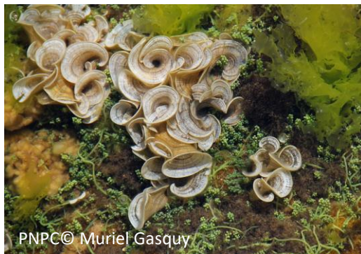
Padine Queue-de-paon Padina pavonica