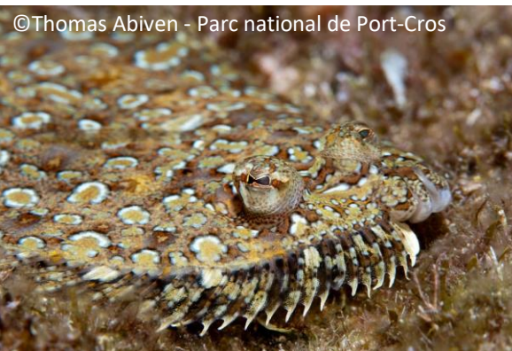
Rombou Bothus podas