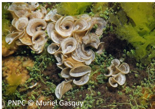
Pavonia Padina pavonica