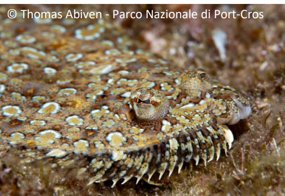
Rombo di rena Bothus podas