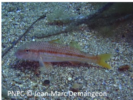
Triglia di scoglio Mullus surmuletus