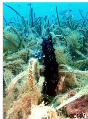
Cetriolo di mare nero durante la stagione riproduttiva