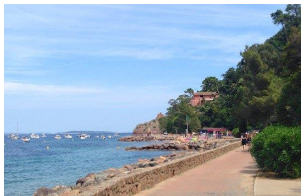
Passeggiata del Pradeyrol