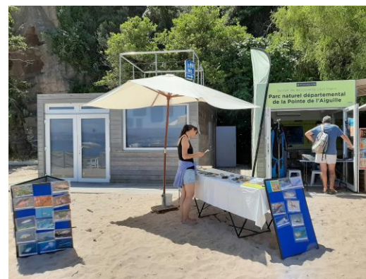
Locale del parco naturale dipartimentale della Pointe de l'Aiguille e posto di primo soccorso a sinistra

Etichetta Turismo e Handicap "in corso".