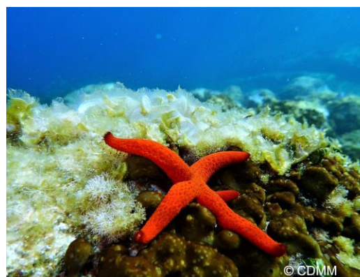
Stella rossa ( Echinaster sepositus )