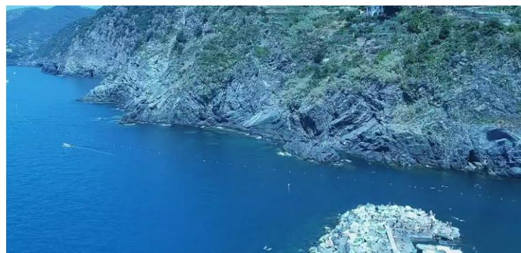
Corsia vista dall'alto

La corsia di nuoto di Vernazza inizia dall'imboccatura del porticciolo turistico dell'omonimo paesino e segue il profilo della costa, direzione Monterosso, per circa 300 metri.